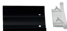
Vue de lame face interne

Nous vous proposons en exclusivité une nouvelle version de cette option avec plus de résistance et de simplicité de pose grâce à son système de clips traversants.